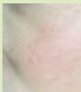
Après deux séances