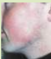
Avant le traitement