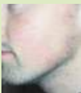
Après deux séances