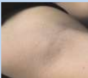
Après trois séances