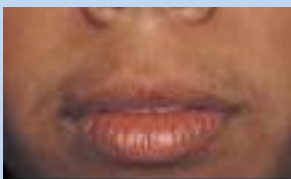
Avant le traitement