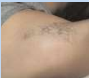
Avant le traitement