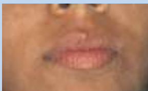
Après trois séances

Consultez le site www.ellipse.org pour voir d'autres photos démontrant l'efficacité des traitements Ellipse.